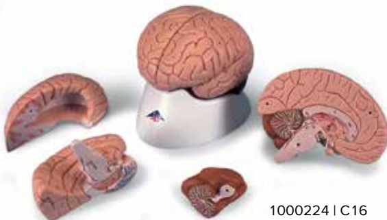
1000224 | C16