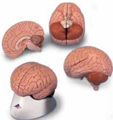
1000222 | C15