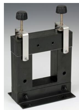
U kern 459700